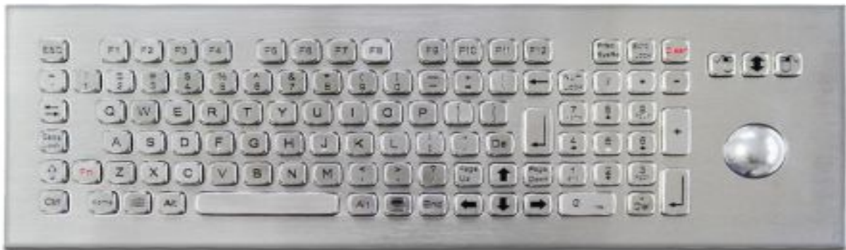
Symbol-Foto - Abbildung kann vom Original je nach Ausstattung abweichen.