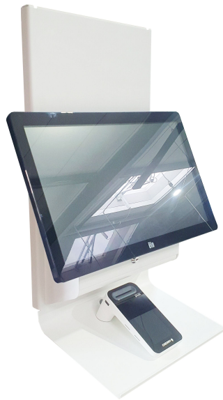
Foto zeigt Kartenterminal- Nicht im Lieferumfang enthalten.